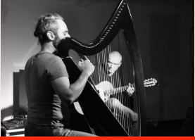
LE BAL DES EXILÉS